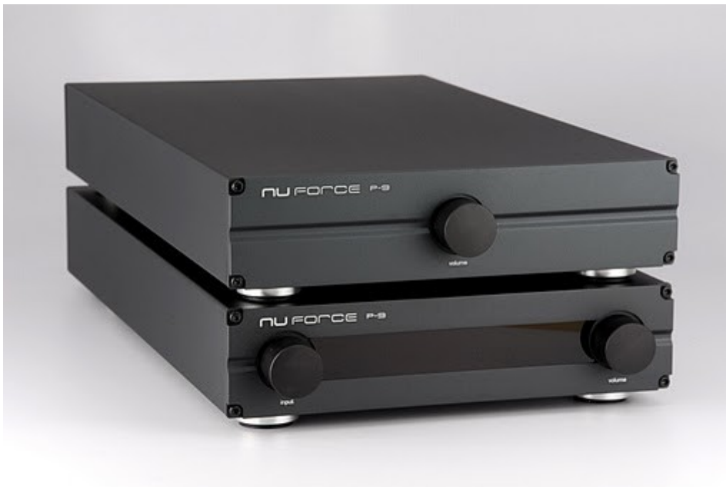
NuForce P-9 Vorstufe

... die V2 ist extrem still. Dies ermöglicht dem Hörer, Details tief im Hintergrund zu hören, die mit anderen HighEnd-Verstärkern verloren gehen oder verschleiert werden. Es ist leicht, einen Verstärker mit dieser Performance zu einem "Meilenstein" und "Tester-Werkzeug" zu küren, was bei mir zu Hause jedoch am meisten beeindruckte, war die Schönheit der Musik, die den Lautsprechern entströmte. Daher ziehe ich es vor, die NuForce Reference 9V2SE schlicht und ergreifend als "Musikmaschinen" zu sehen.