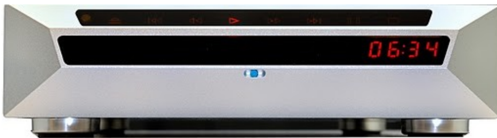
NuForce CDP-8 Cd-Player