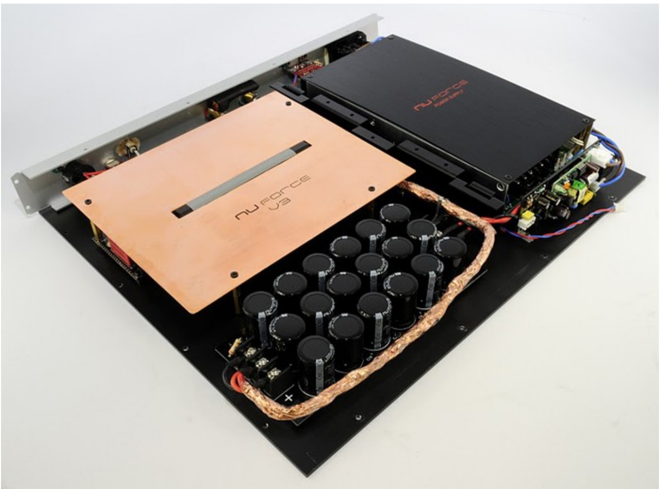
NoForce Ref 18 Monoblock Innenleben