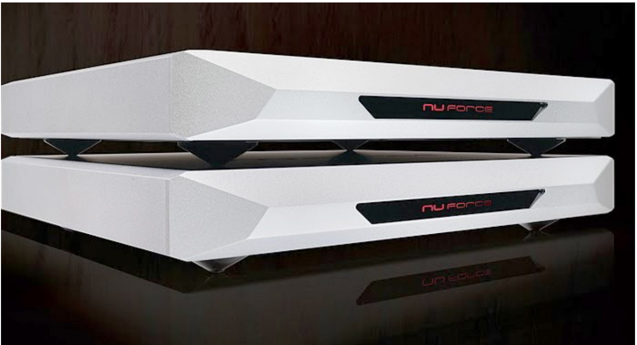
NuForce Ref18 Monoverstärker

Streichinstrumente behalten ihre vollständigen harmonischen Anteile, die Beurteilung unterliegt natürlich den Hörgewohnheiten. So sind viele Audiophile gewöhnt an an das Vorhandensein von Verzerrungen 2. Harmonischer, die man als durchaus angenehm empfindet und gern mit harmonischem Reichtum übersetzt. Aber es bleiben Verzerrungen und auch wenn sie angenehm für das Ohr sind, verzichte ich lieber darauf zugunsten von mehr Realistik. Nuforce erhält die natürlichen Klangfarben von akustischen Instrumenten perfekt. Holz, Leder, Messing erscheinen als die Stoffe, die den Geigen, Gitarren, Trommeln, Becken ihre „Stimme“ geben.