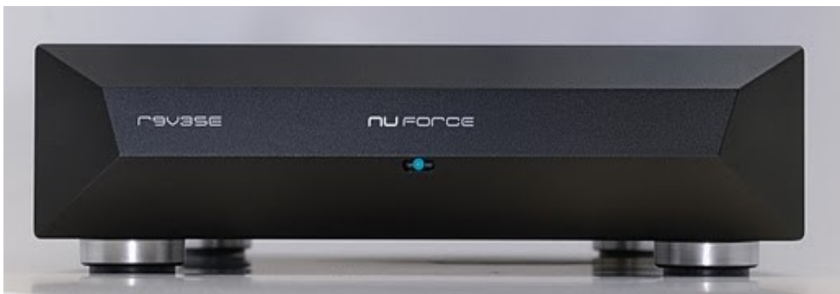
NuForce Ref9V3SE Mono Amp

So wird man sehr schnell zu der Überzeugung kommen, dass man die bekannten Hifikriterien so auf NuForce nicht anwenden kann. Räumlichkeit, Ortbarkeit, Klangfarben, Auflösung, nicht zuletzt Bass, Mitten und Höhen – alles bekommt eine neue Bedeutung, da alles in einem nicht gekannten Maße realer ist. Alles ist selbstverständlich da, auf nichts muss man sich konzentrieren.